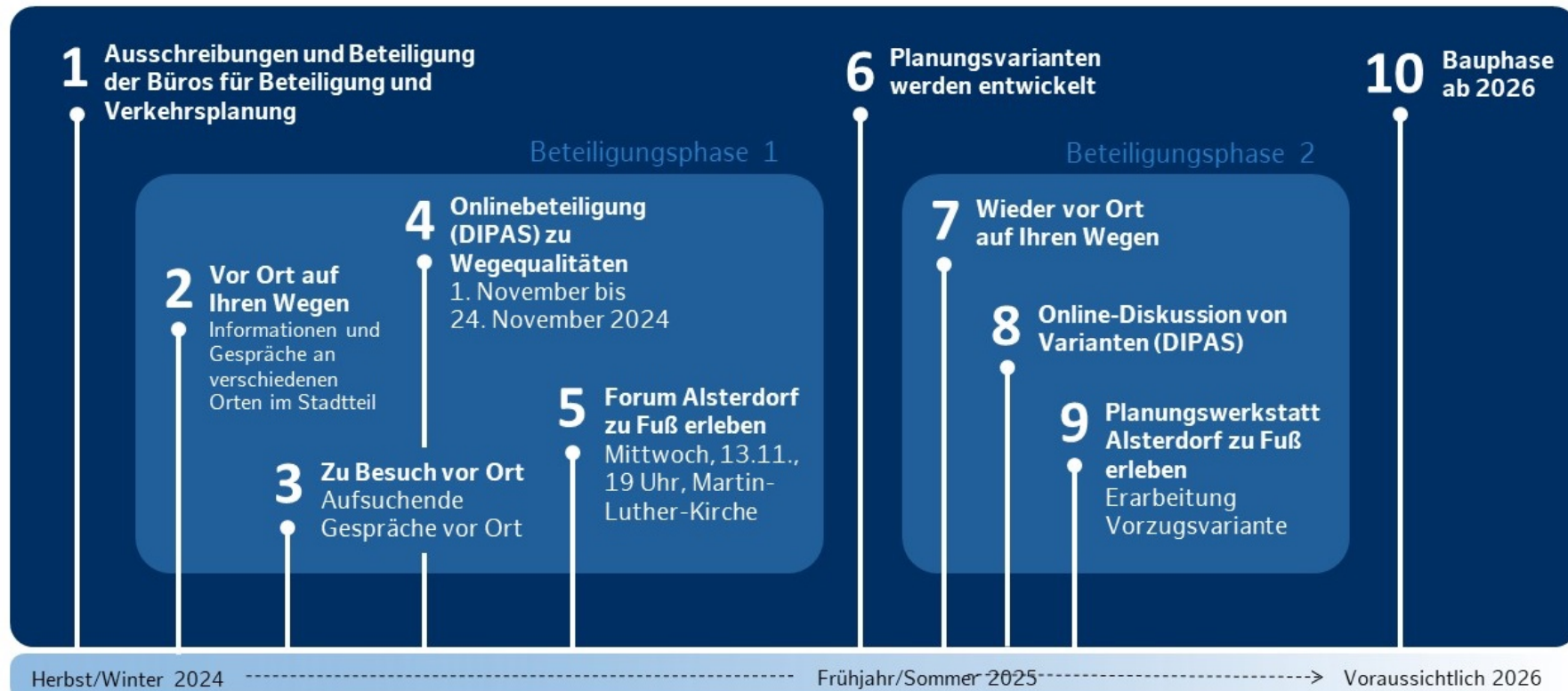
Abbildung 1: Projektablauf inklusive des Beteiligungsprozesses